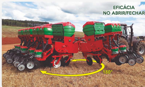
EFICÁCIA NO ABRIR/FECHAR