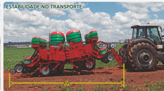
ESTABILIDADE NO TRANSPORTE