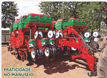
PRATICIDADE NO MANUSEIO