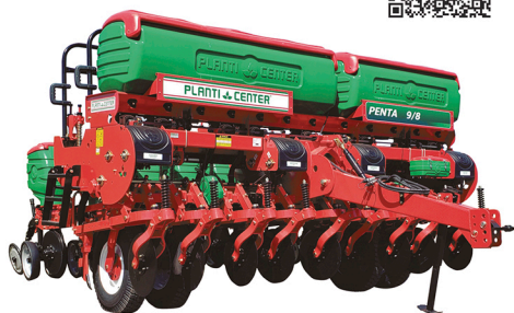
Linhas de semente pivotadas